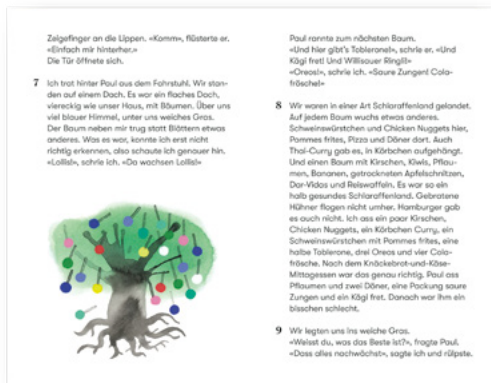
Das Dach SJW Nr. 2626 CHF 6.00 pro Heft