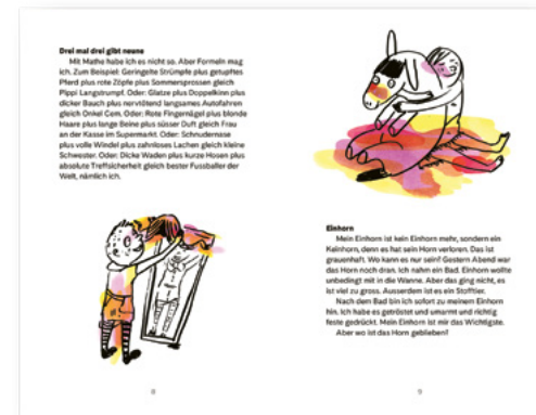
Moni heisst mein Pony SJW Nr. 2653 CHF 6.00 pro Heft