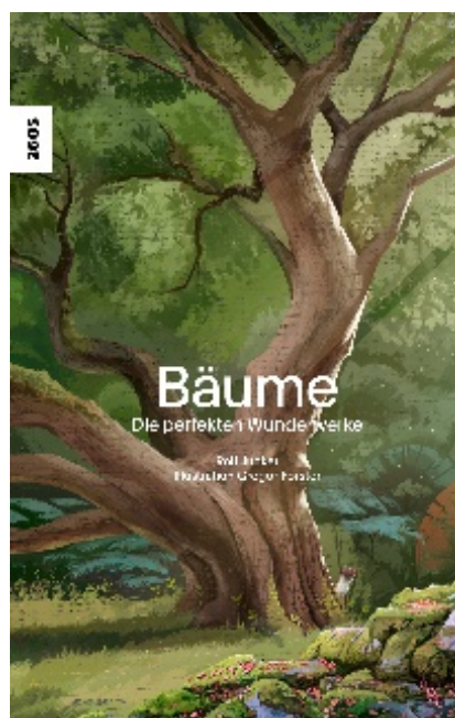
SJW Nr. 2605